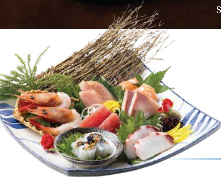
竹 (12切/pcs) Bamboo Set $388