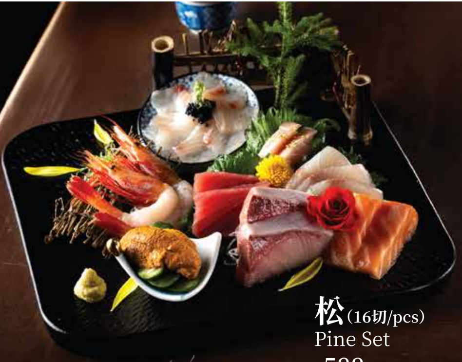
松 (16切/pcs) Pine Set $588