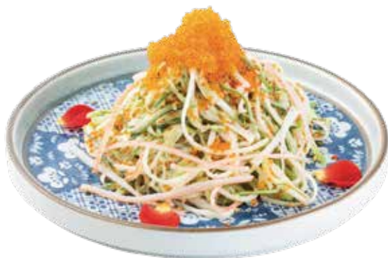
蟹籽沙律 | とびっ子サラダ Crab Roe Salad