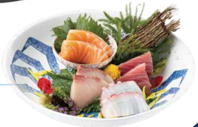
梅 (8切/pcs) Plum Set $238

※ 圖片僅供參考 | Photos for reference only ※ 写真はイメージで説明用です。実物は異なる場合がございます。 ※ 另設加一服務費 | Subject to 10% service charge | 10%のサービス料がかかります。