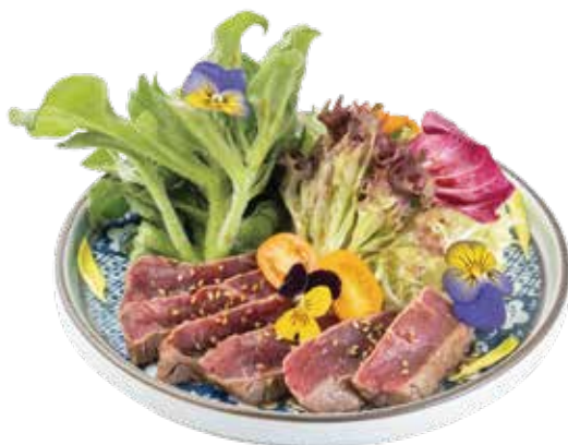
火炙牛肉冰菜沙律 炙り和牛とアイспラントサラダ Grilled Beef & Iceplant Salad